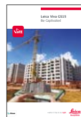
Leica Viva GS15