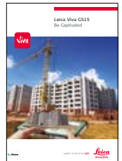
Leica Viva GS15