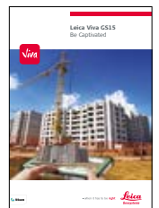
Leica Viva GS15