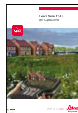
Leica Viva TS16