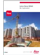
Leica Nova MS60