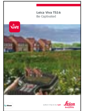
Leica Viva TS16