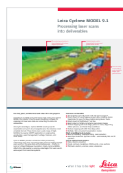
Leica Cyclone MODEL